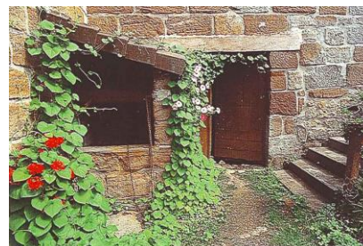
Au sud de Saint-Aulaire, le bel habitat du Roc, bien appareillé, avec ses nuances de grès allant du gris au rouge foncé.