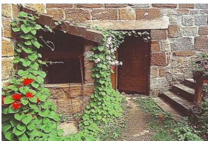
Au sud de Saint-Aulaire, le bel habitat du Roc, bien appareillé, avec ses nuances de grès allant du gris au rouge foncé.